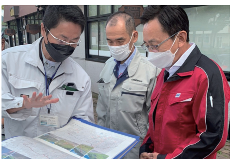
▲大雨災害現場の視察 国道274号(日勝峠)