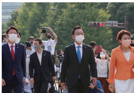
▲参議院議員として、気持ちを新たに初登院