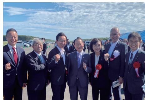
▲北海道スペースポート セレモニー出席