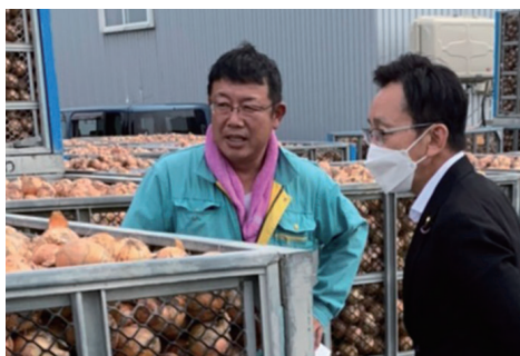
▲農作物の状況を視察