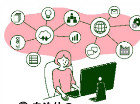
⑤ 自治体のAI・RPAの利用推進