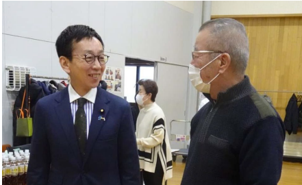
道内支援の皆様と懇談