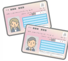
③ マイナンバーカードの普及促進・利用の推進