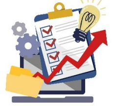
② 自治体情報システムの標準化・共通化