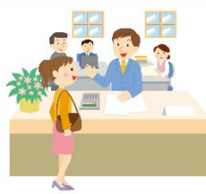
① 自治体フロントヤード改革の推進