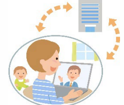
⑥ テレワークの推進