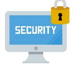
④ セキュリティ対策の徹底