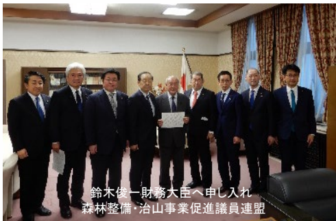
鈴木俊一財務大臣へ申し入れ 森林整備・治山事業促進議員連盟