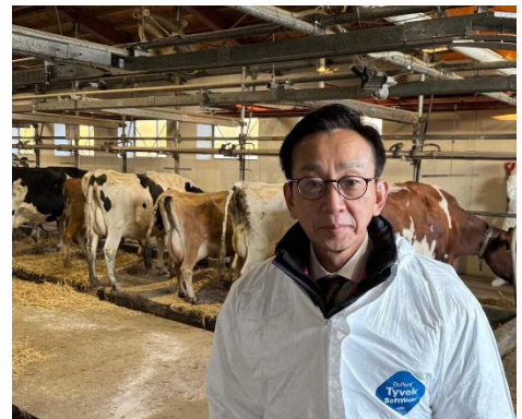
自民党 畜産・酪農対策委員会 北海道視察