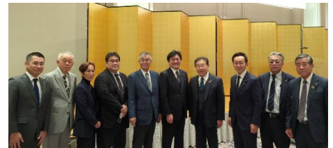
全日本トラック事業政治連盟冬季懇談会