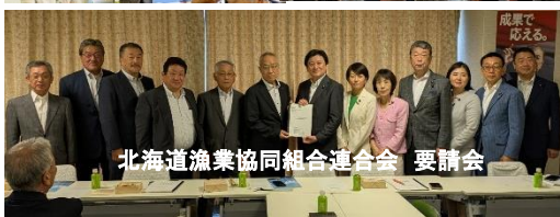
北海道漁業協同組合連合会 要請会