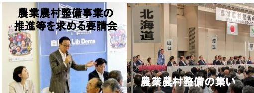
農業農村整備事業の推進等を求める要請会