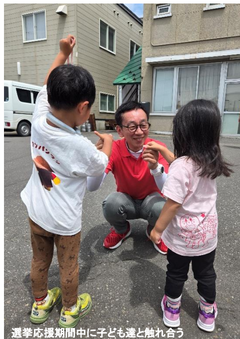
選挙応援期間中に子ども達と触れ合う