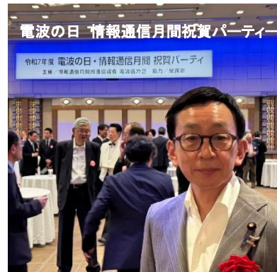
電波の日 情報通信月間祝賀パーティー