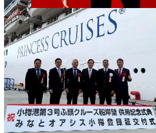
祝 小樽港第3号ふ頭クルーズ船岸壁 供用記念式典 みなとオアシス小樽 登録証交付式