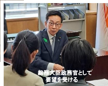
総務大臣政務官として 要望を受ける