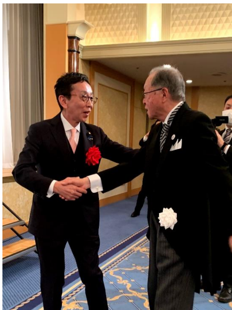
「お世話になっている企業の式典へ出席