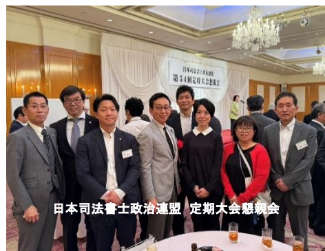
日本司法書士政治連盟 定期大会懇親会