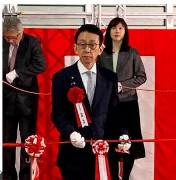
小樽港第3号ふ頭クルーズ 船岸壁 供用記念式典