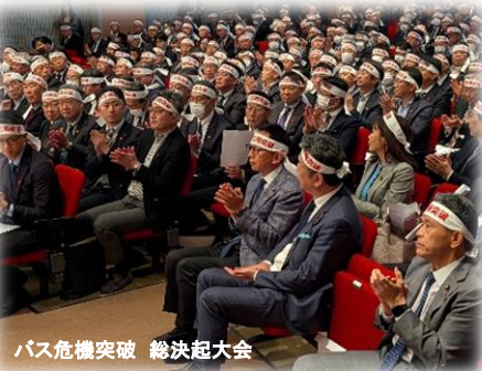
バス危機突破 総決起大会