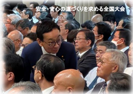
安全・安心の道づくりを求める全国大会