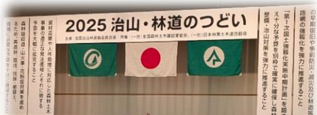
治山・林道のつどい