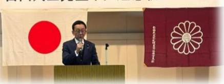
自由民主党豊平区連懇親パーティー