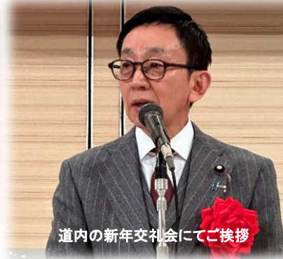
道内の新年交礼会にてご挨拶