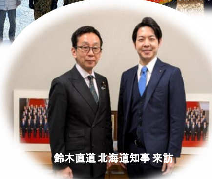
鈴木直道 北海道知事 来訪