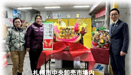
札幌市中央卸売市場内