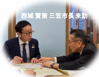
西城 賢策 三笠市長 来訪