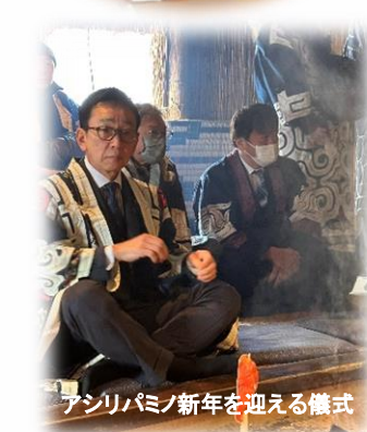
アシリバミノ新年を迎える儀式