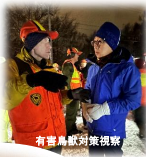
有害鳥獣対策視察