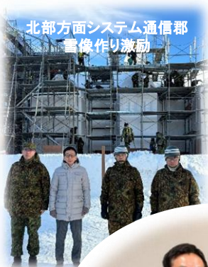
北部方面システム通信郡 画像作り激励