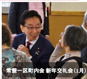
常盤一区町内会 新年交礼会(1月)