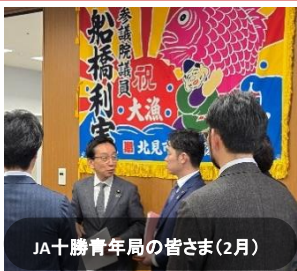
JA十勝青年局の皆さま(2月)