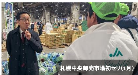
札幌中央卸売市場初セリ(1月)