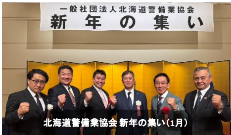
一般社団法人北海道警備業協会 新年の集い