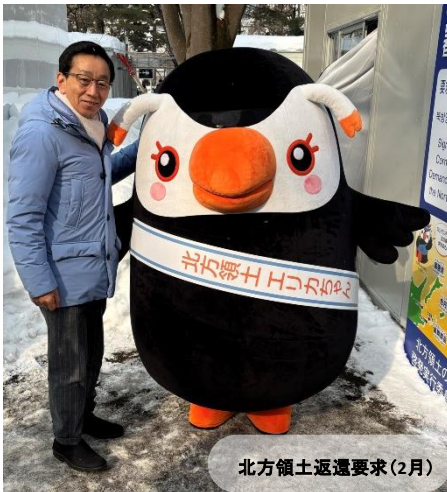
北方領土返還要求(2月)