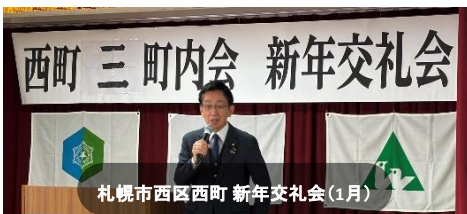
西町三町内会 新年交礼会