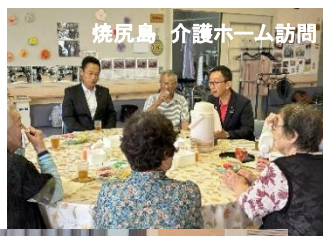
焼尻島 介護ホーム訪問