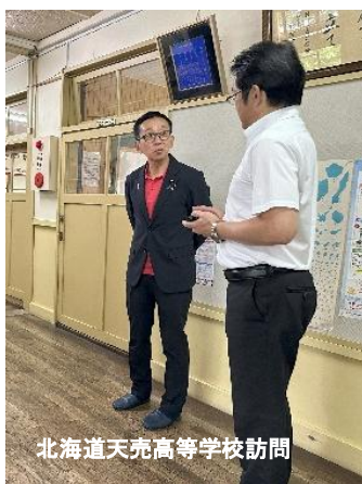
北海道天売高等学校訪問