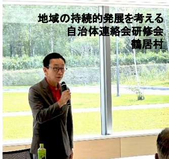
地域の持続的発展を考える 自治体連絡会研修会 鶴居村