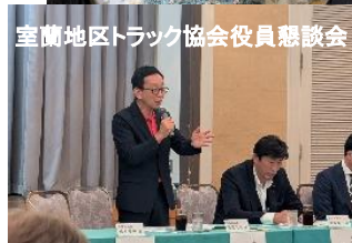
室蘭地区トラック協会役員懇談会